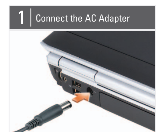
连接交流适配器 連接 AC 轉接器 AC アダプタを接続します AC 어댑터 연결

주: 전지가 완전히 충전되지 않 을 수 있으므로 컴퓨터를 처 음 사용시 AC 어댑터를 사용하 여 새 컴퓨터에 전원을 연결하